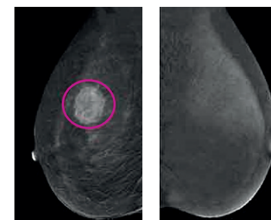
Контрастная маммография (после введения контрастного вещества визуализируется узловое образование)